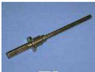
BF 3 cutter shank