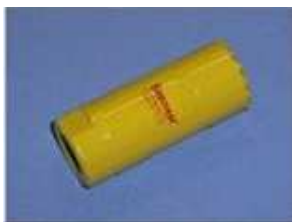
BF 1 metal cutter Ø22 mm