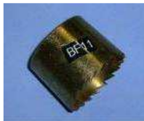
BF 11 plast cutter Ø39,5 mm