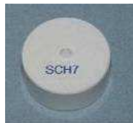
SCH 7 center template