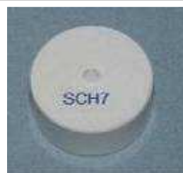
SCH 7 center template