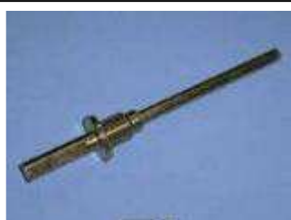
BF 3 cutter shank