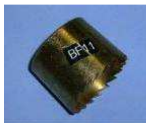
BF 11 plast cutter Ø39,5 mm