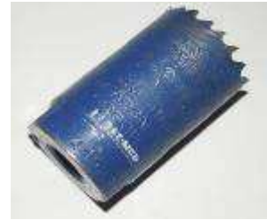
BF 44 metal cutter Ø30 mm