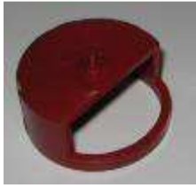
Sch 35 center template Ø 30 mm