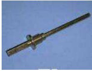
BF 3 cutter shank